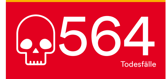
Todes- und Arbeitsunfälle im Baugewerbe in Deutschland 2017